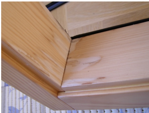
Okno przed renowacją